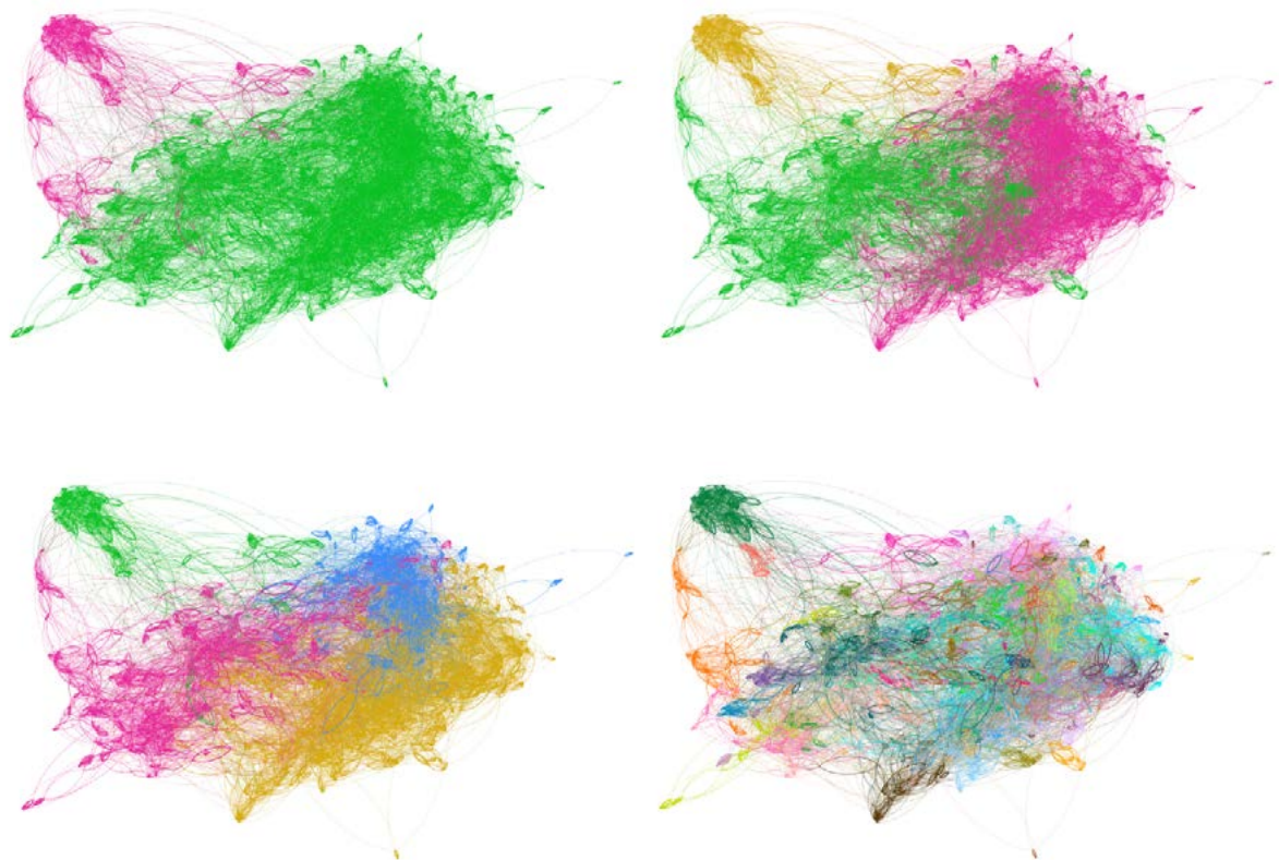
Wykres 3. Analiza sieciowa korpusu z modularnym podziałem na (od lewej i od góry) 2, 3, 4 i 70 skupisk